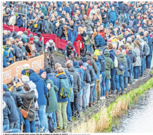
Een heel publiek langs het water bij de vesting in Hulst in 2021.

Is het een goed idee om veel gemeenschapsgeld in het WK veldrijden 2026 te steken als de gemeente Hulst in 2026 afstevent op een structureel tekort van 1 miljoen euro? De SP denkt van niet, zegt voorzitter Patrick Keizer.